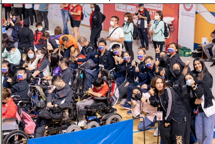
閉幕式場邊花絮照